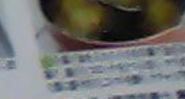
8 揚げたコロッケを2つに切り、サラダ菜を敷いた器に盛り付けミニトマトを飾り、ケチャップを添える。