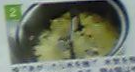
2 ゆであがったら水を捨て、水気を飛ばしてからつぶす。卵4個はゆで卵にしておく。