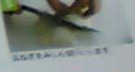
3 玉ねぎをみじん切りにします。