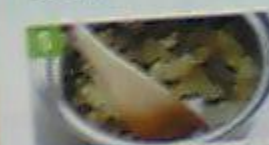
5 ゆで卵を2でくみ、小麦粉、卵、パン粉の順に衣をつけ、揚げ油を入れたお湯の鍋で油をかけながら揚げる。