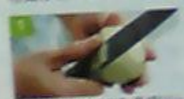
1 じゃがいもの皮をむき、乱切りにしてゆでます。