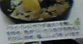
4 フライパンにサラダ油大1を熱し、玉ねぎを炒め、色がついたら合いびき肉も入れさらに炒め、塩、しょう油を少々、ボウルに移し①のじゃがいもと混ぜ合わせる。