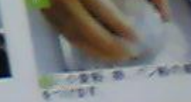
7 揚げたコロッケを2つに切り、サラダ菜を敷いた器に盛り付けミニトマトを飾り、ケチャップを添える。